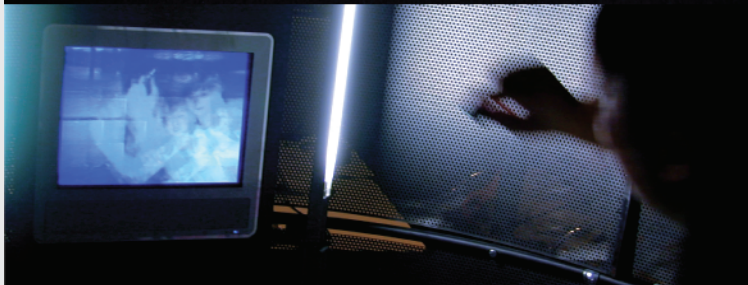
2003 Siggraph Emerging Technologies 採択 平成15年度文化庁メディア芸術祭エンターテインメント部門奨励賞受賞